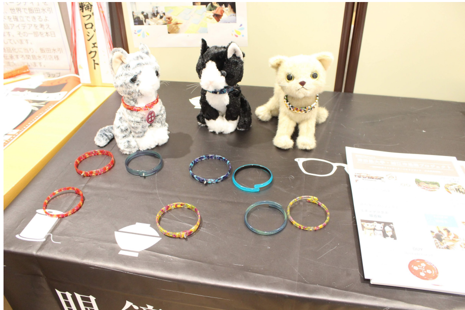
展示ブースの様子