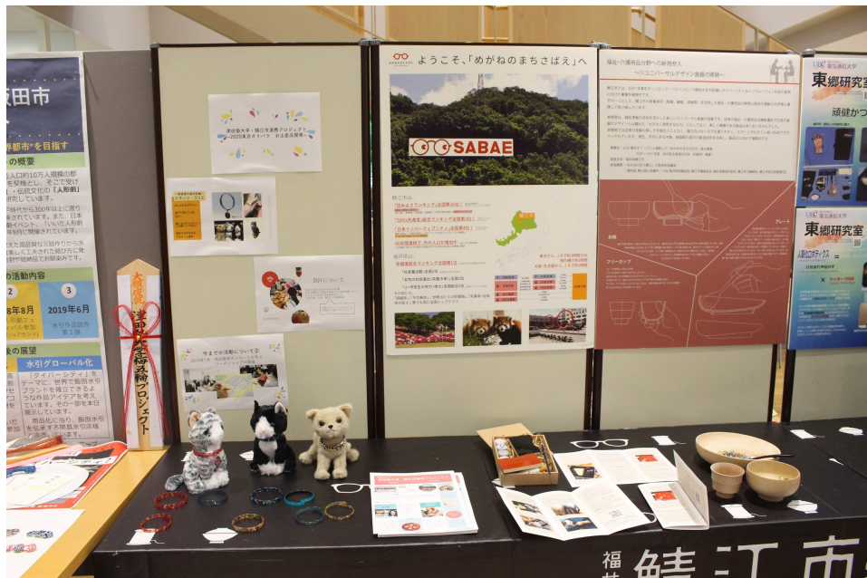
展示ブースの様子