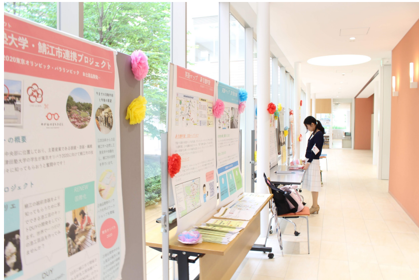
展示ブース（準備中）の様子